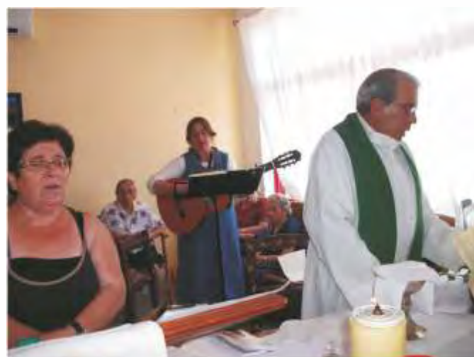
As convicções religiosas dos idosos são respeitadas e animadas.