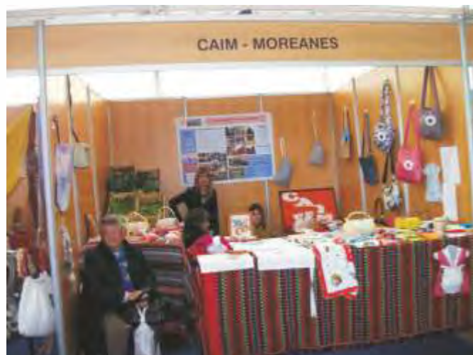
Festival de Peixe do rio.