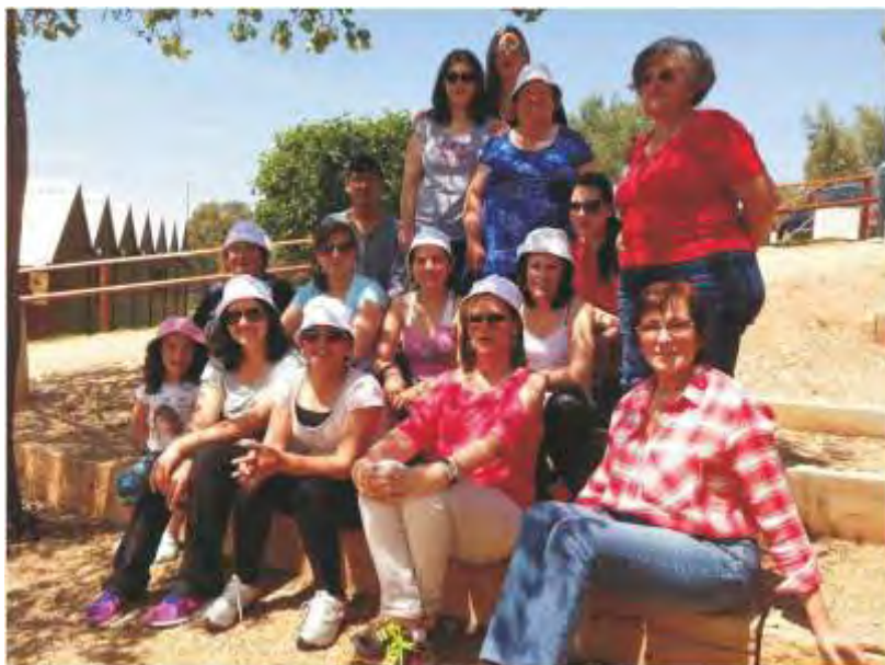
1.º de Maio, Dia do Trabalhador