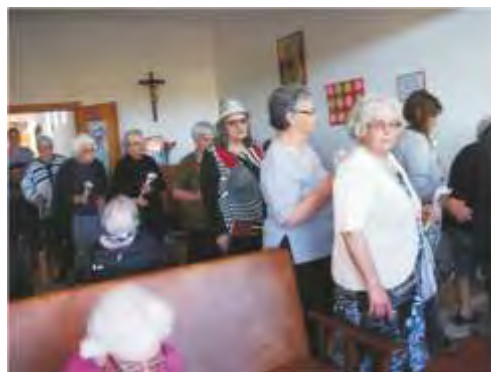
Procissão das Velas