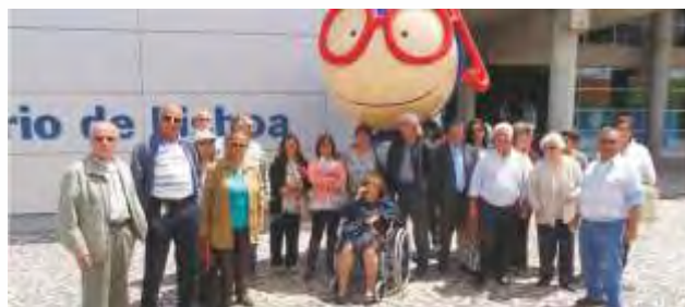
Visita ao Museu da Fábrica da Loiça de Sacavém