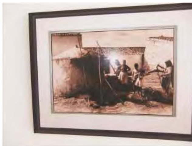
Elaborámos a exposição de fotos antigas de Moreanes, que esteve patente nas instalações.