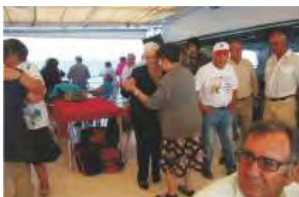
Passeio de barco pelo Guadiana