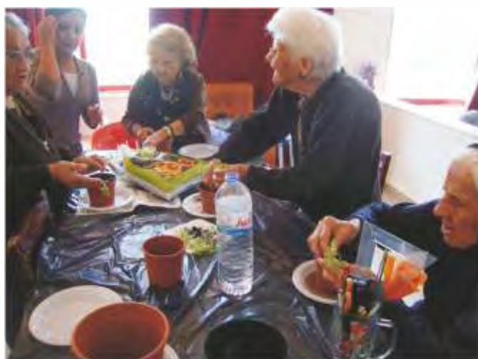
Santos Populares - Preparação.