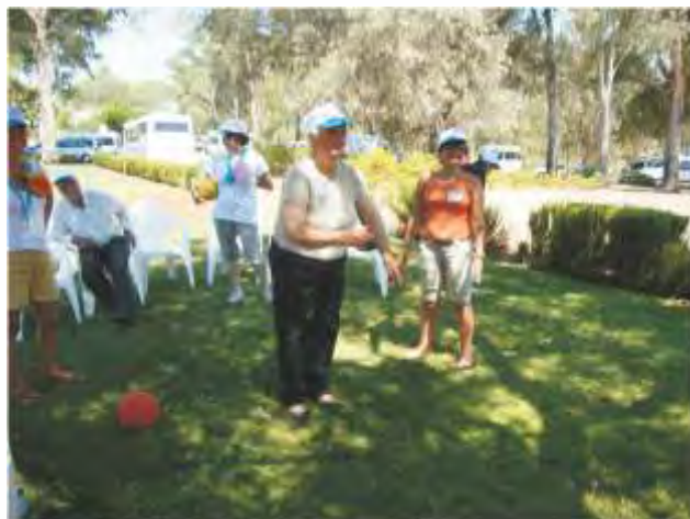
Participação nos Jogos de Verão na Mina de São Domingos.