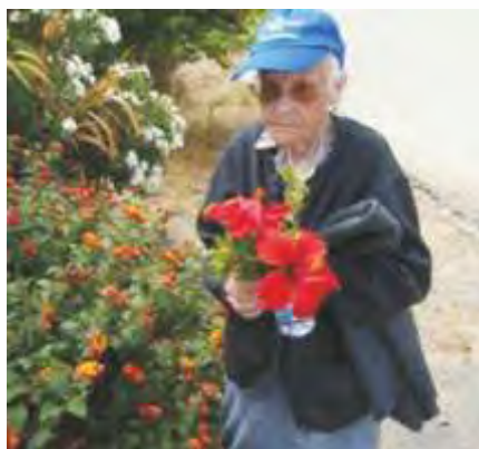
Quinta Feira D'Ascensão