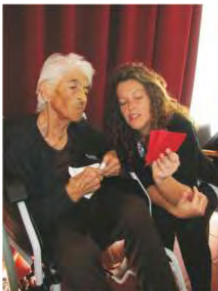
A animação e o convívio são momentos de grande alegria para todos.