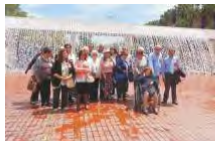
Visita ao Oceanário