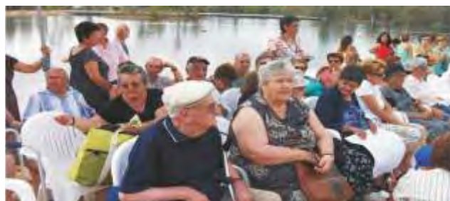
Assistência ao programa da RTP Verão Total Mina de São Domingos