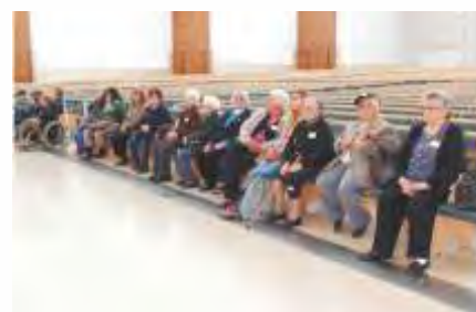
Visita a Fátima